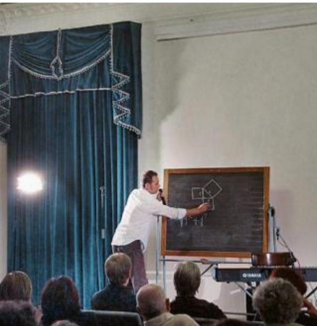
Durante la performance, frequente il ricorso alla lavagna

TEATRO/2. Sandrigo Storie d'acqua e di fiume a palazzo Mocenigo